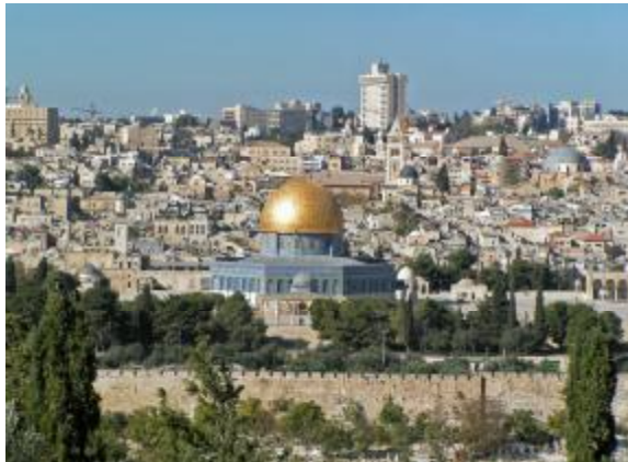
Der Blick aus dem Gebetsraum: Mit der Sicht vom Ölberg auf den Tempelberg

Ein weiterer Punkt wurde uns wichtig und wir wollen zur Umsetzung beitragen: Über dem Holocaust-Mahnmal in Jerusalem steht das Leitmotiv dieser Stätte wie folgt aus Joel 1,2-3: "Hört das ihr Ältesten, und achtet darauf alle Bewohner des Landes: Ist so etwas jemals in euren Tagen oder in den Tagen eurer Väter geschehen? Erzählt davon euren Kindern, und eure Kinder ihren Kindern, und deren Kinder dem künftigen Geschlecht".