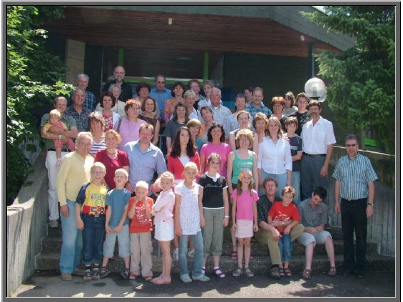
Gemeindeglieder (unvollständig) und Gottesdienstbesucher ; aufgenommen am Sonntag, 17.Juni 07